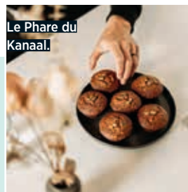
Le Phare du Kanaal.