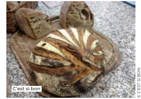
C'est si bon