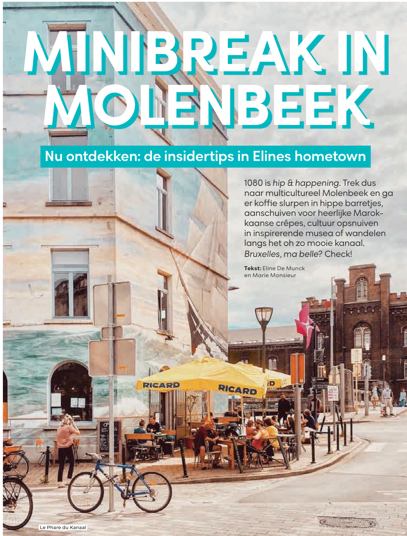
Le Phare du Kanaal